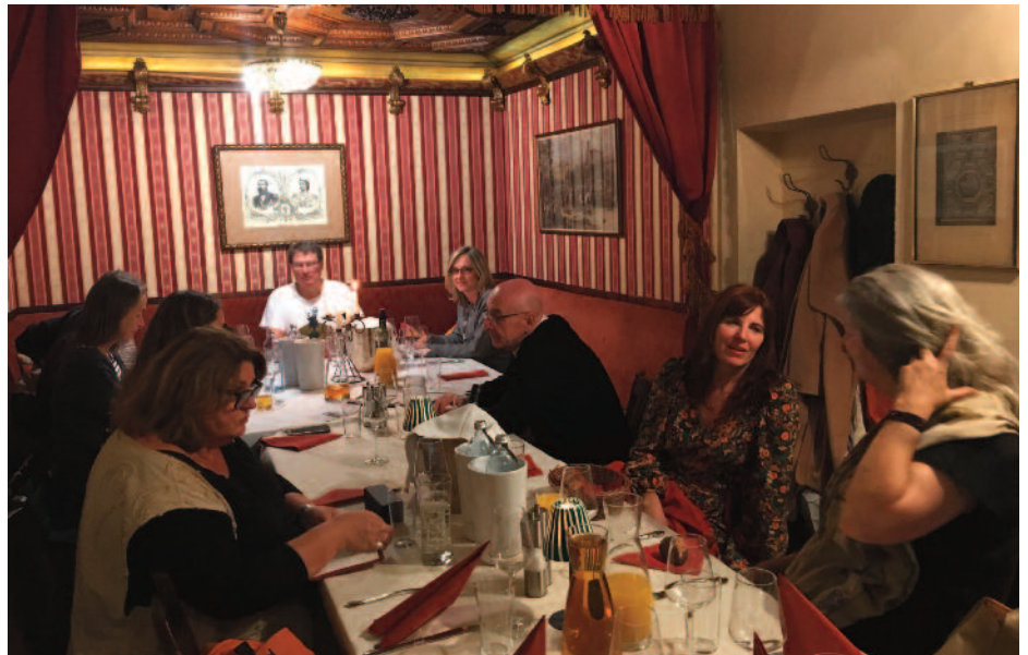
Die Kaisperlounge bot den passenden Rahmen für das Spätsommertreffen.

Ich denke, es war für alle die da waren,